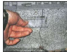
基礎のひび割れ幅の計測