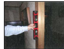
水平器による柱の傾きの計測